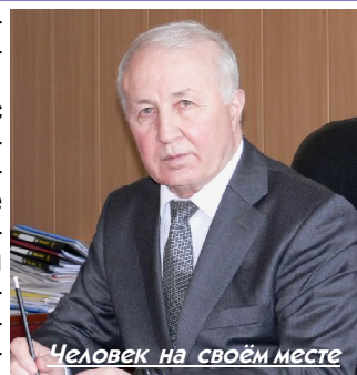
Человек на своём месте

стопримечательности. Сейчас его основное пристрастие – художественная и документальная литература.