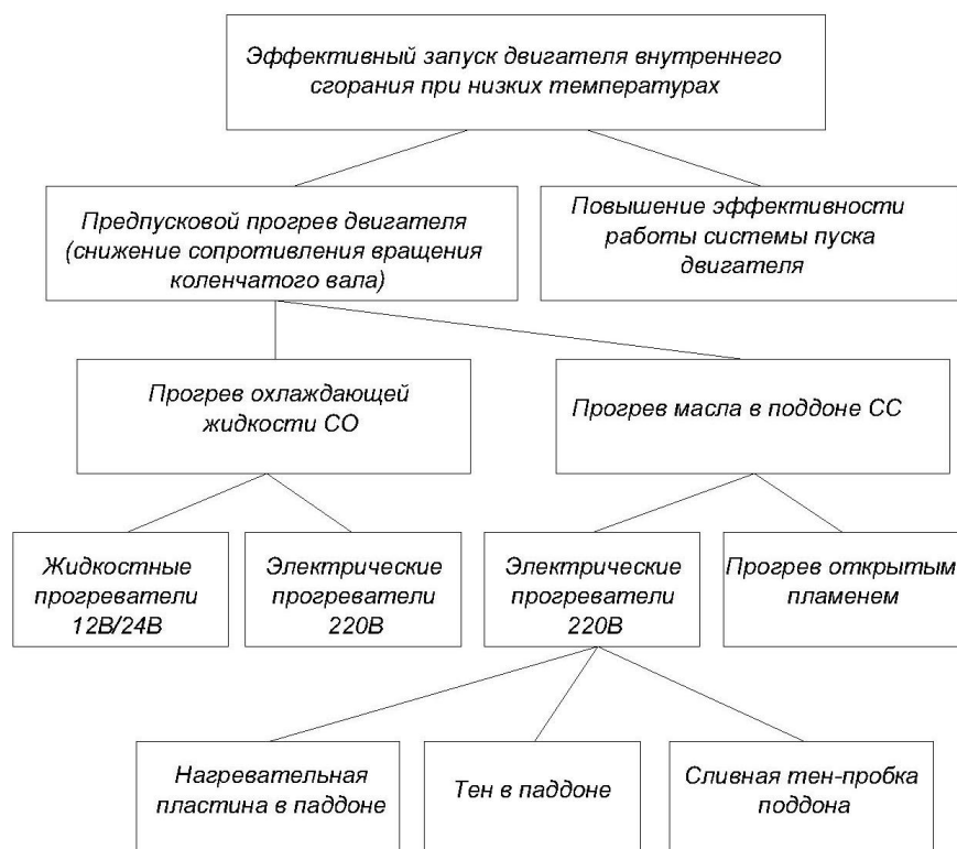
Рисунок 1. Способы эффективного запуска двигателя внутреннего сгорания при низких температурах